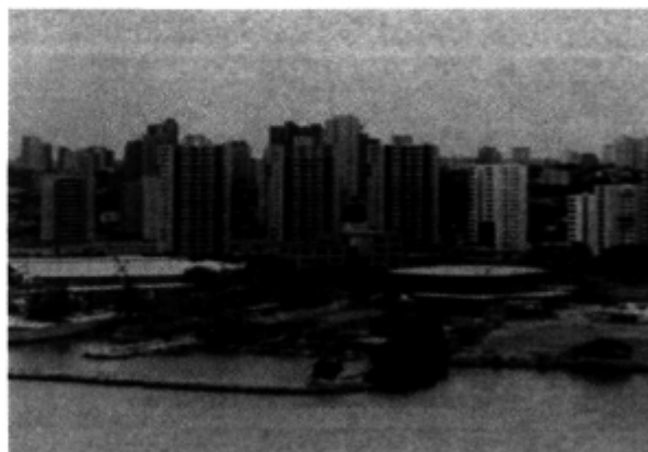
Esteban Iazzetta. 2001

gran valor para el turismo ávido de extender la experiencia vacacional más allá de una mera presencia física.