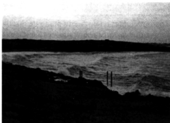
Esteban Iazzetta. 2001