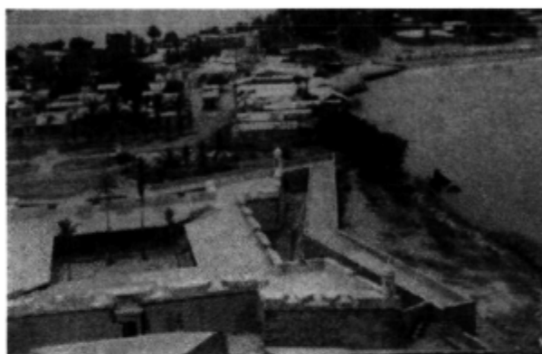
Esteban Iazzetta, 2001

este municipio se encuentra la localidad de San Carlos, un destino turístico de interés para los habitantes de Maracaibo por sus playas y su fuerte español de San Carlos, el Torreón y las dunas de Zápara.