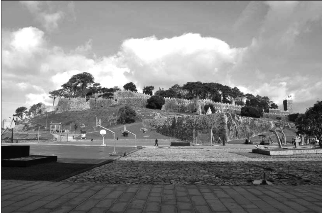
Figura 1 Vista general de la fortaleza de Monte Real