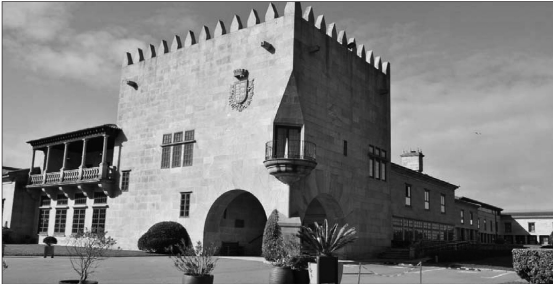
Figura 5 Detalle de la Torre del edificio principal del Parador