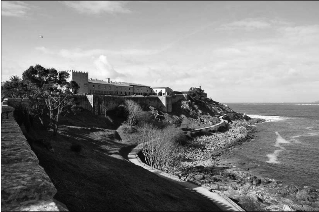
Figura 4 Vista general del Parador Conde de Gondomar