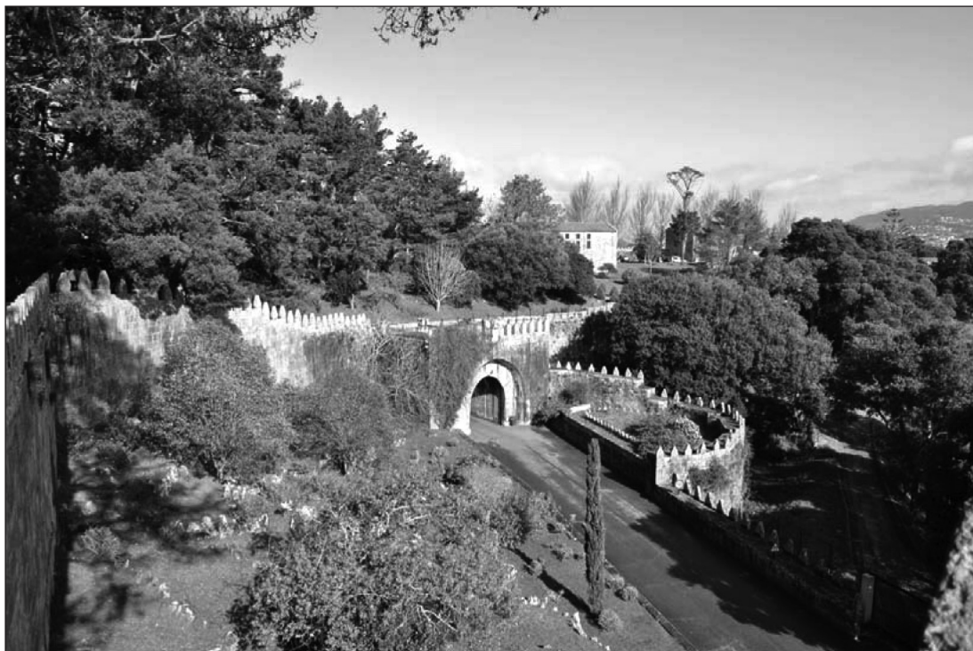
Figura 2 Detalle del Sistema de fortificación