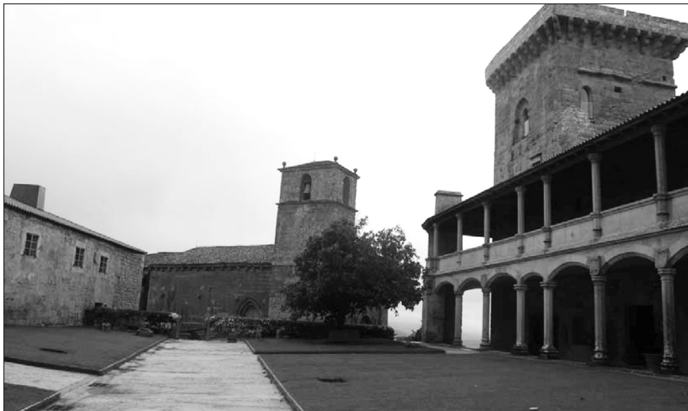
Figura 1 Parador del Castillo de Monterrei

(figura 1), hoy tan solo, y apenas, queda en la memoria a través de algún dato documental que lleva a reconocerlo como uno de los tres – los otros dos eran de mercedarios, de 1484, y jesuitas, de 1555 (Vid. Taboada Chivite, 1951:245-262; Dasairas Valsa, 1994: 95-99; 101-105) - y el más antiguo de los que existió en lo que fue aquella villa de realengo, asentada en el solar de un antiguo castro, nacida, hacia 1266, cuando era rey Alfonso X el Sabio (Leza Tello, Pérez Formoso, 2012:110). Pues bien, hasta aquí llegaron los frailes mediante una fundación que ha de datarse entre 1290 y 1302, año en el que hay constancia de su existencia al aludirse, en un testamento, “a os frades menores de Monte Rey...” (Leza Tello, Pérez Formoso, 2012: 204-205).