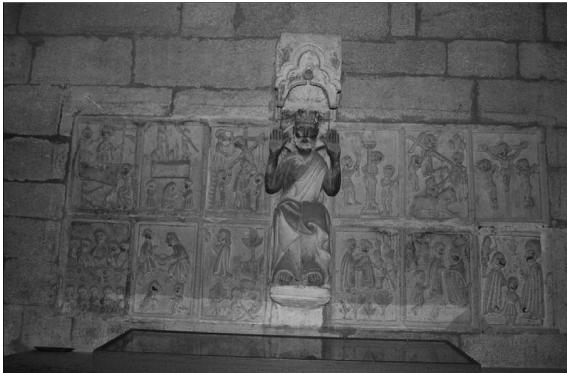
Figura 3 Retablo pétreo de la iglesia de Santa María de Monterrei

¿Se conserva otra imaginería relativa a los franciscanos? Cabe valorar la posibilidad de que el retablo pétreo de la iglesia de Santa María de Monterrei, a datar hacia 1435, provenga de la primera iglesia franciscana (figura 3) ; entre sus relieves puede verse una representación de la Guardia del Santo Sepulcro en la que se nos muestran, precisamente, franciscanos (Vid. García Iglesias, 2015: 25-29). En la misma igle-