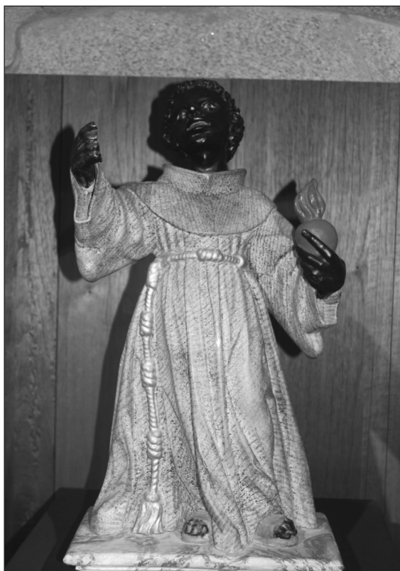
Figura 4 Bernardino de Sena, Parador del Castillo de Monterrei