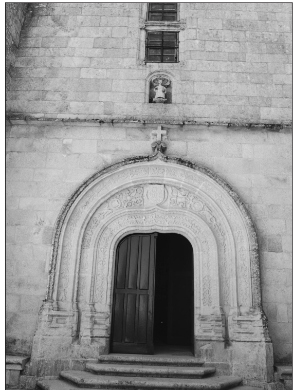
Figura 5 Puerta de la iglesia del Bon Xesús de Trandeiras

Quien levantaba aquel templo era Bartolomé Nosendo, muy probablemente portugués, reconocido como "... buen maestro de cantería que había hecho y acabado la sacristía de este monasterio (Xunqueira de Ambía) y otras obras y estaba haciendo la iglesia de Sandianes..." (Couceiro Freijomil, 1938: 503-511; Conde Valvís Fernández, 1962: