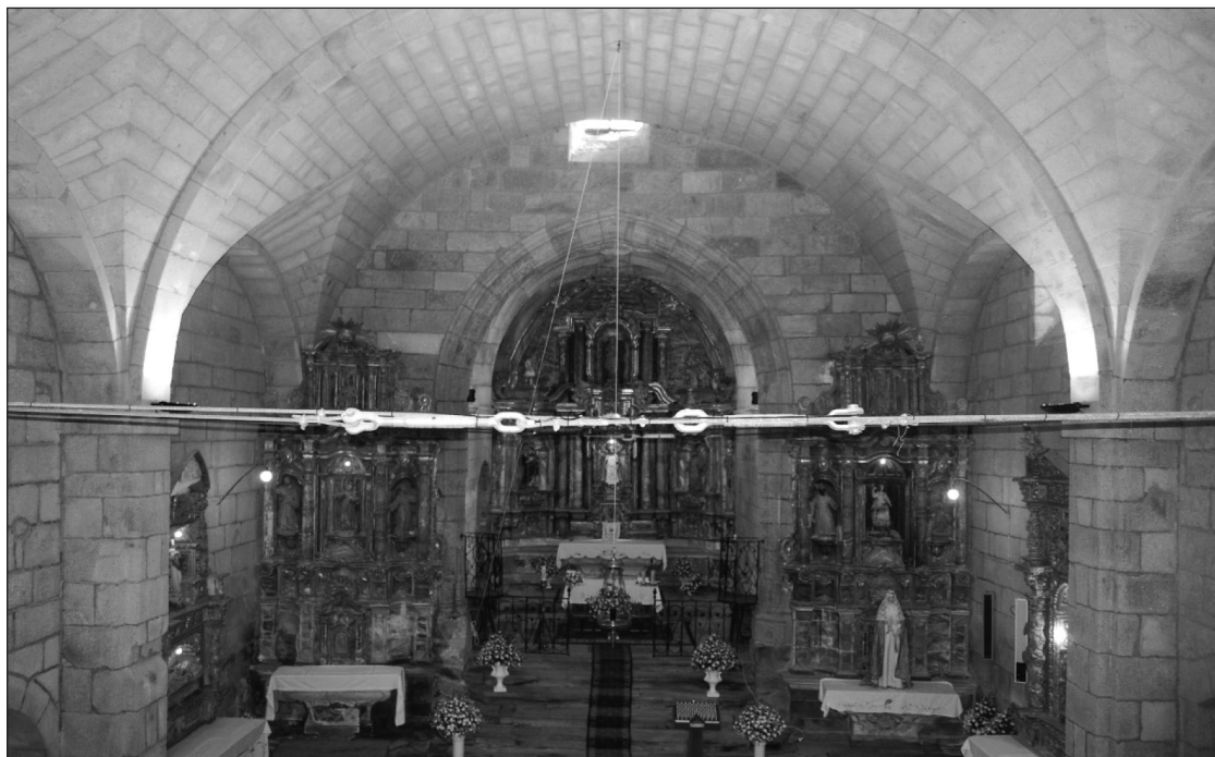
Figura 7 Interior de la iglesia del Bon Xesús de Trandeiras