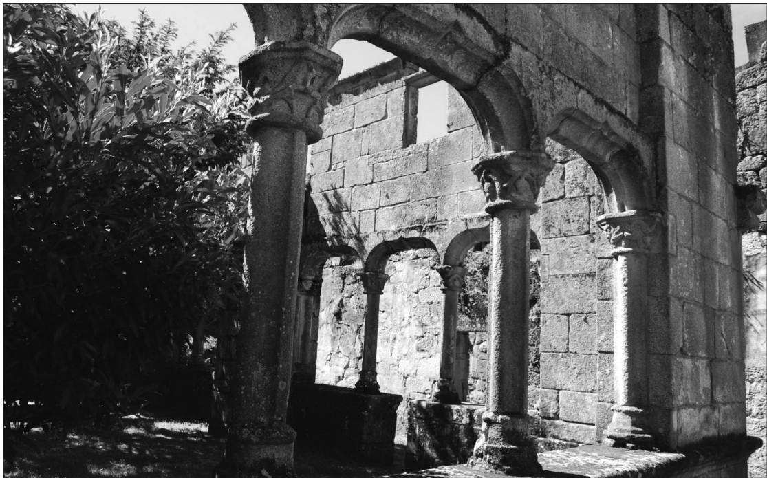
Figura 6 Claustro den antiguo convento del Bon Xesús de Trandeiras

Ya hacia los años finales del siglo XVI se va a añadir a la iglesia una capilla, a la que se accede desde el presbiterio y que se dispone en el lado del evangelio. Esta dedicada a la Concepción y tiene en su pared del lado del evangelio un arcosolio que ampara