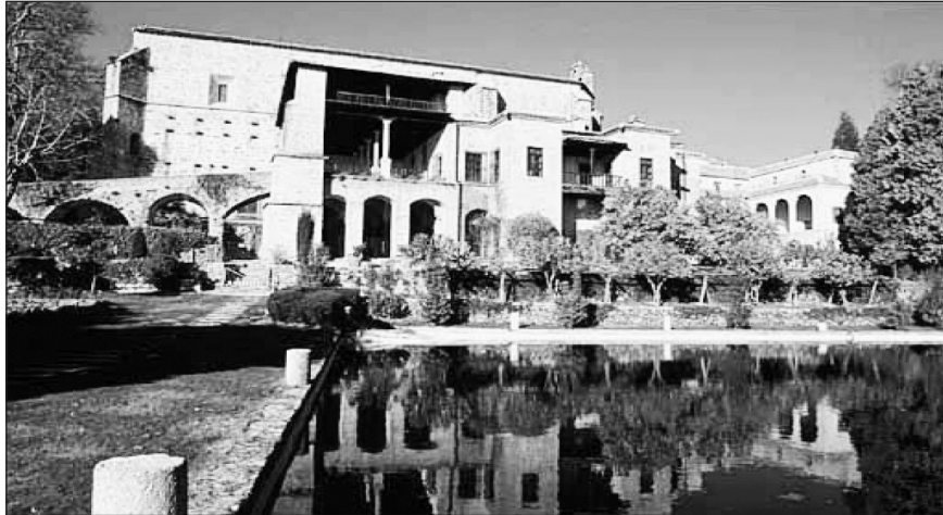
Figura 1 Imperiales y Reales Sitios