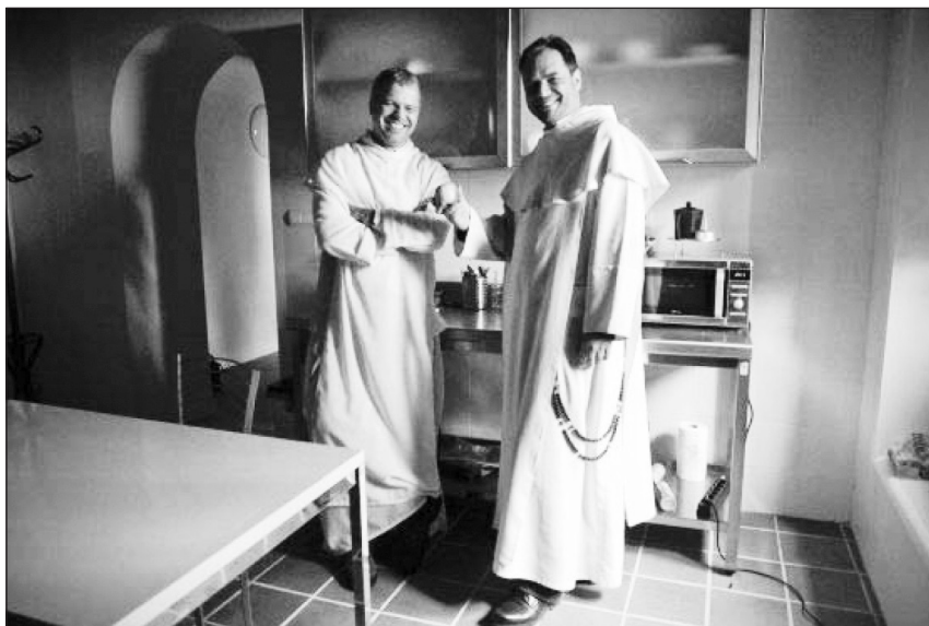
Figura 5 Monjes Paulinos