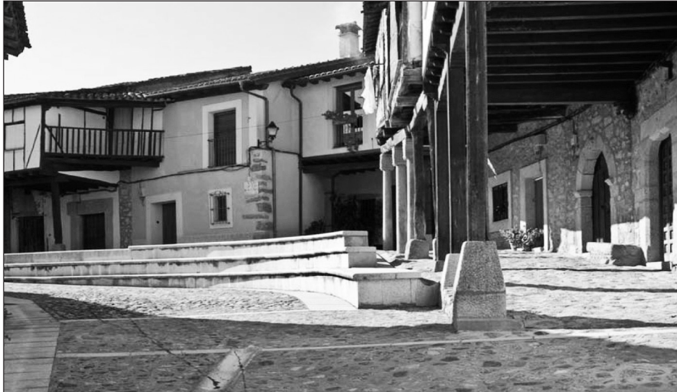
Figura 4 Villa de Yuste de la Vera. Plaza de Don Juan de Austria