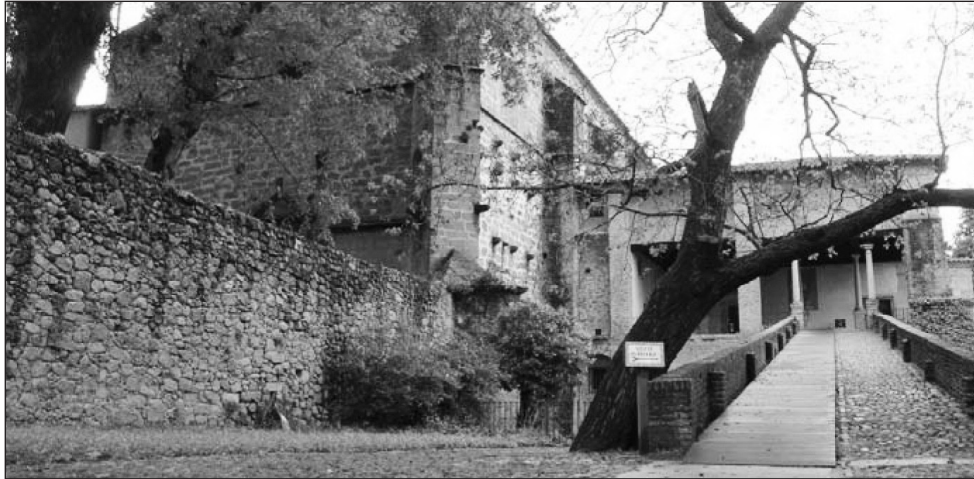
Figura 3 Acceso a los Imperiales y Reales Sitios