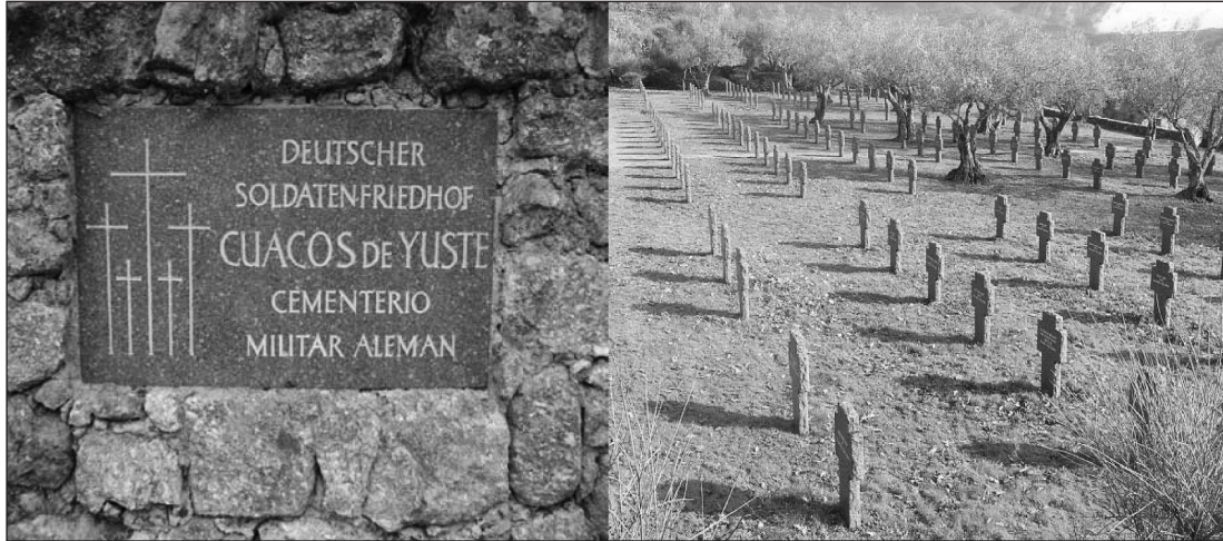
Figura 2 DEUCHTSCHER SOLDATENFRIEDHOT