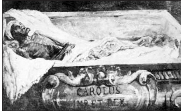
Figura 7 Restos del Rey Emperador, urna abierta en la Primera República