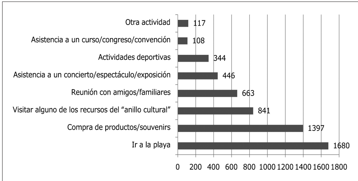
Gráfico 2 Actividades generales realizadas en el verano en la ciudad de Santander