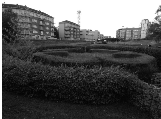
Figura 3. Trèfle , de Dominique González-Foerster

Convertido en parque urbano en 2008, se asienta sobre un antiguo solar industrial. Este espacio verde de veintitrés mil metros cuadrados fue promovido principalmente por el artista Piero Gilardi, quien contribuyó al nacimiento del Arte Povera, un movimiento del que surgieron grandes figuras en la capital piemontesa.