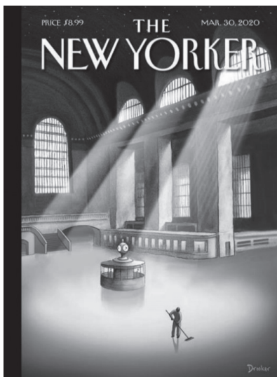
Figura 3. Portada de Eric Drooker. “Grand Central terminal” para The New Yorker de 30 de marzo de 2020