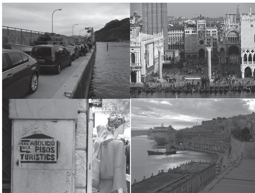
Figura 2. Fotos sobre masificación.

Fotos: Tazones (Asturias), Venecia, Mallorca y Malta.