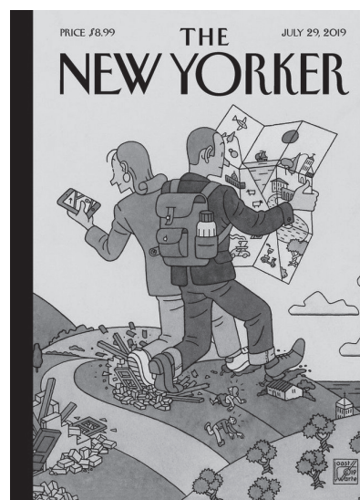
Figura 1. Portada de Joost Swarte. “Power Trip” para The New Yorker del 29 de julio de 2019