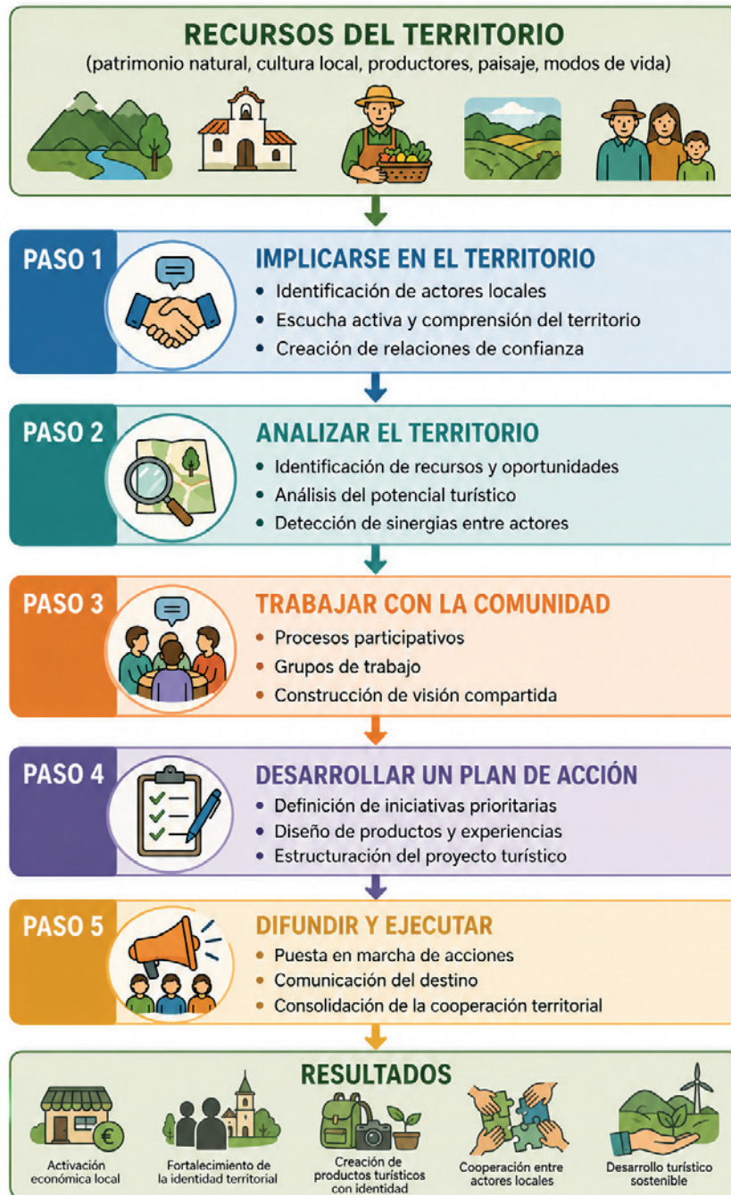
Figura 1. Esquema del modelo de turismo generativo

Nota. La Figura 1 sintetiza el esquema general de funcionamiento del modelo de turismo generativo.