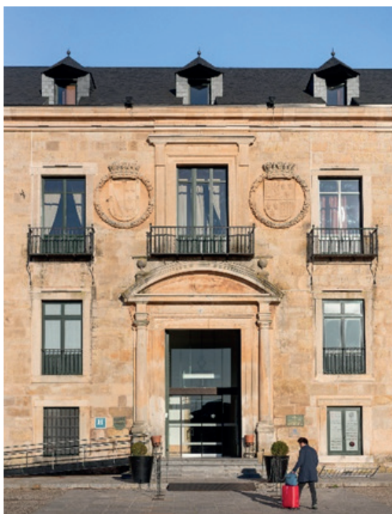
Figura 3. Fachada principal del Parador de Lerma

La iniciativa Descubre Paradores , en esta primera fase de ejecución, se ha desarrollado en ocho paradores emblemáticos: Gredos, Oropesa, Úbeda, Mérida, Hondarribia, Chinchón, Lerma y Santo Estevo. Para la selección de estos ocho, la red ha tenido en cuenta aspectos fundamentales como la representación geográfica (el proyecto llega a siete Comunidades Autónomas y a ocho ciudades o localidades) y la representación de diferentes tipologías de edificios que incluyen: conventos (Paradores de Mérida y Chinchón), palacios (Paradores de Úbeda, Oropesa y Lerma), castillos (Parador de Hondarribia), monasterios (Parador de Santo Estevo) y edificios de nueva construcción (Parador de Gredos).