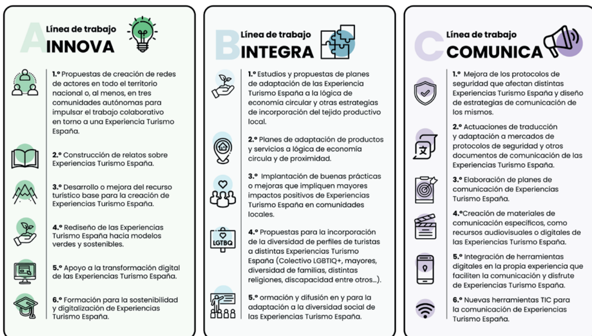
Figura 2. Líneas de trabajo INNOVA, INTEGRA y COMUNICA de las Experiencias Turismo España.