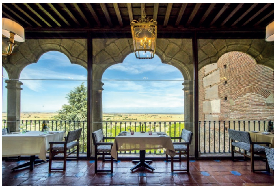
Figura 1. Fotografía interior Parador de Oropesa

Como objetivo principal, Descubre Paradores busca acercar el valor patrimonial de los paradores de la red de Paradores al público, ampliando la experiencia tradicional de visita a través de recorridos guiados virtuales y gamificados, con un enfoque accesible y riguroso. Incluye, además, la publicación de ocho volúmenes monográficos que recogen estudios actualizados y académicos sobre los mismos. El proyecto nace con una clara vocación divulgativa sobre el patrimonio artístico, histórico y natural de los establecimientos hoteleros, lo que lo convierte en una experiencia turística singular, innovadora y de gran valor cultural.