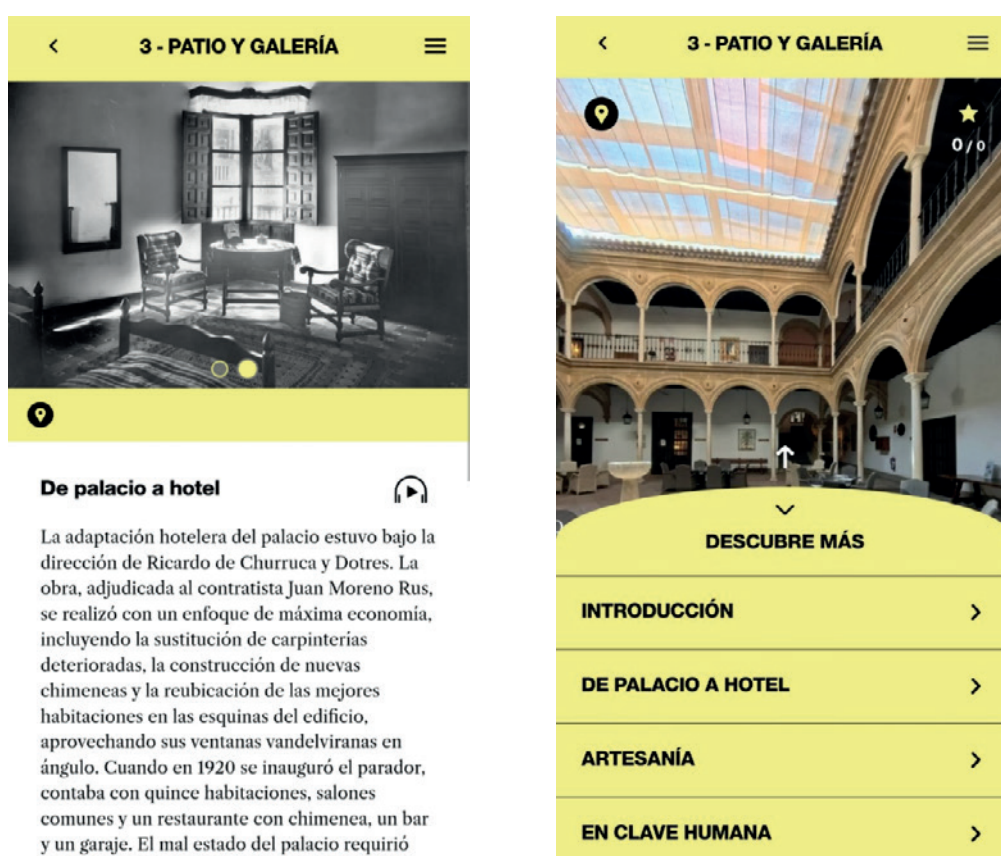
Figura 8 y Figura 9. Aplicación web de Descubre Paradores