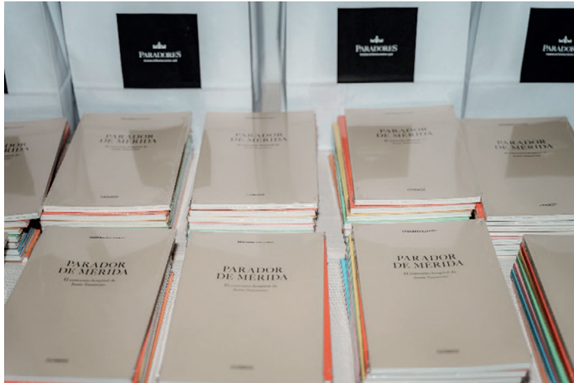
Figura 4. Colección Descubre Paradores