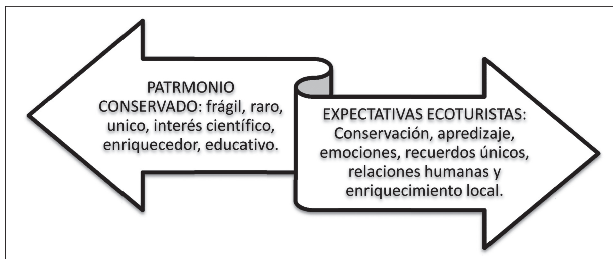
Gráfico 2 Inter - relación de conceptos competitivos

En la búsqueda de mensajes para comunicar los valores del Lobo Ibérico es necesario profundizar en la interpretación del patrimonio. Ya que se trata de una herramienta imprescindible (Tilden, 1957; Kohl, 2010)